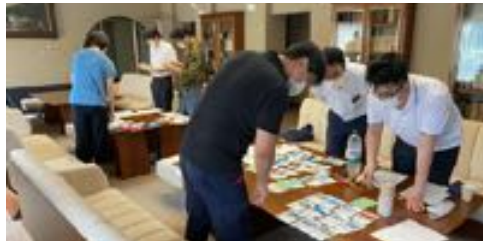
▲防災教育のワークショップを開催