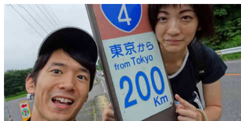
▲白河～福島100kmを夫婦で徒歩縦断