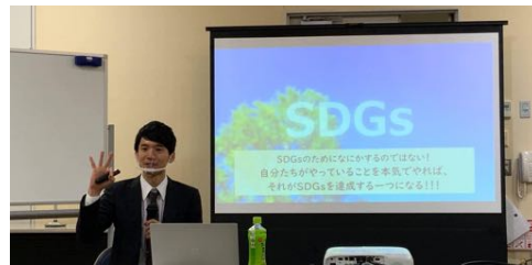
▲SDGsアドバイザーとして伴走支援