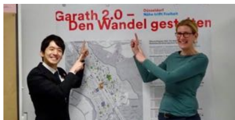
▲国内外の地方自治の現場で研修。コミュニティを軸とした地域づくりを実践